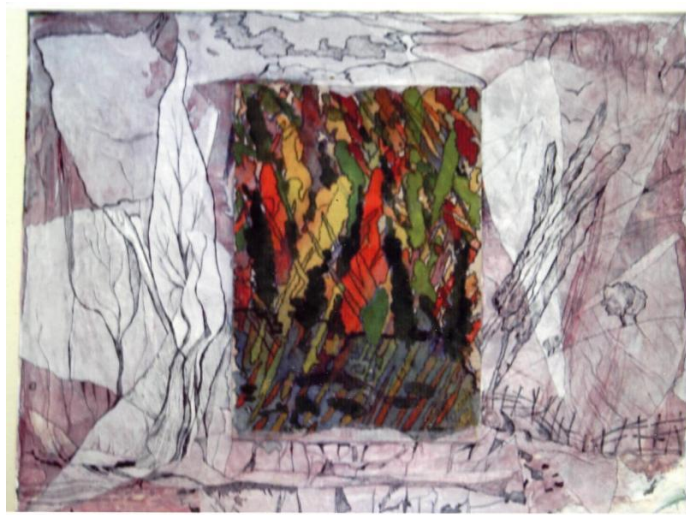
“Oltin kuz”. Tarshon.(Akvarel) 50x60.(2021)

yugurib, yuqori tezlik bilan harakatlanayotgan otiqlar tasvirini ko‘ramiz. Yuqoridan pastga qarab tortilgan shtrixlar otlarning tezligini bildiradi. Qora chizgilarda tasvirlangan chavandoz va otning dinamikasini musavvir asosiy planga olib chiqqan. Orqa planda esa tog‘lar harakatlanayotgandek, gapirayotgandek tugyon urishi gavdalanadi. Rassom o‘zining bu asarida sovuq ranglardan foydalangan. Asosan aralashma texnikasida, guash, akvarelda ishlagan.