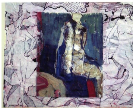
“Ayol qomati”. Tarshon. 50x60.(2021)

“Oltin kuz” kartinasida mintaqamizning kuz faslida turli rang tuslariga kirib jilvalanishini abstrakt yo‘nalishda yaratgan. “Oltin kuz” kartinasining markazida joylashgan tasvirda O‘zbekistonimizning kuzgi serjilo manzaralari ko‘zga tashlanadi. Kartinaning markaziy qismi abstrakt ko‘rinishda ishlangan. Bu manzarani tomoshabinga yetqazib berish uchun rassom; zafaron, samoniy, to‘tiyo, lojuvard, lolaroy, nilgun, nofarmon, to‘tigoy, qora, qizil, samoniy kabi sovuq kolaritlardan foydalangan. Rassom o‘zining ichki dunyosini, hissiyotlarini shu kolaritlar orqali o‘z ijodida namoyon qilgan. Atrofida esa kulrang, binafsha, qora, kolaritlardan; grafikada teraklar, uylar atrofida qadimda yog‘ochdan qilingan reshotkalar, tog‘lar, adirlar, dalalar tasviri tushirilgan.