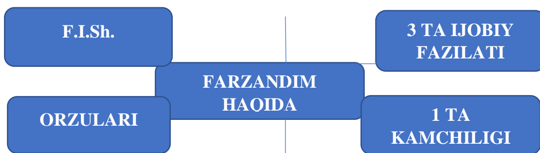
3-rasm. “To‘rt taraf” metodi (ota-onalar uchun).

Bu metodni o‘quvchilarda bajartirgandan keyin, xuddi shu metodni “Farzandim haqida” (3-rasm) deb nomlab ota-onalar bilan o‘tkazilgan majlisda o‘tkaziladi. Majlisda qatnashgan ota-onalar metodda berilgan savollarga javob yozib bo‘lishganidan so‘ng, ularga o‘z farzandlari bergan javoblarni o‘zlariniki bilan solishtirish uchun tarqatiladi.