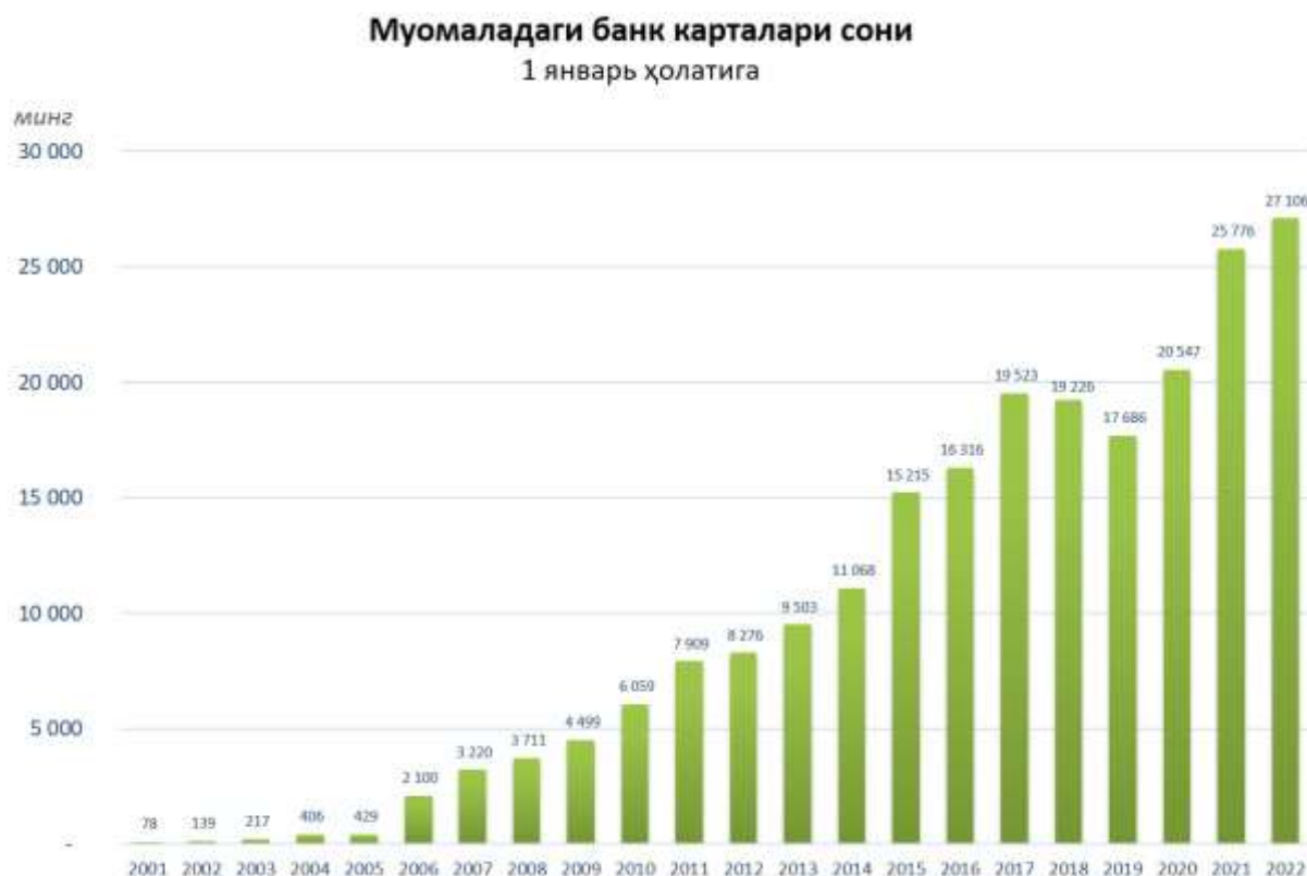
1-rasm. Muomaladagi bank kartalari soni

Markaziy bank 2022-yil 1 yanvar holatiga bank kartalarining statistikasini o‘z saytida keltirib o‘tgan. Quyidagi rasmda yillar kesimida bank kartalari soni keltirilgan: